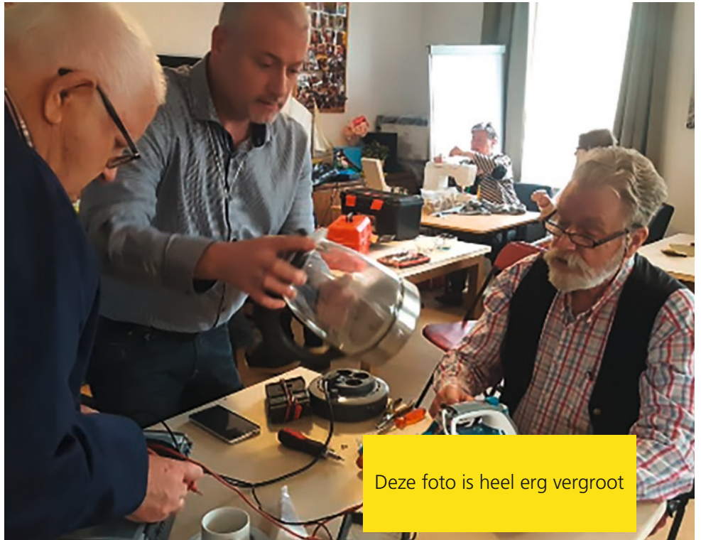
Deze foto is heel erg vergroot