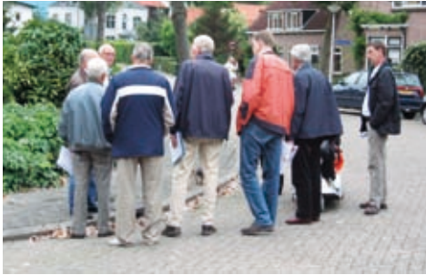
blijkbaar iets gevonden

Op 16 september 2008 verzamelde zich weer een twintigtal mensen in het gebouw 'De Deining' om kritisch te gaan kijken naar de begaanbaarheid van twee verschillende routes richting de 'Crimpenhof'.