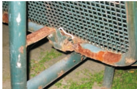
bankje op scherp

Het merendeel van de opmerkingen heeft wel te maken met de bestrating.